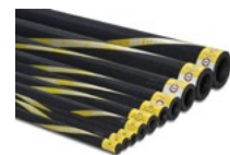
24h-Ersatzteile und Service