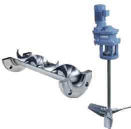
Mischer & Rührwerke 1)